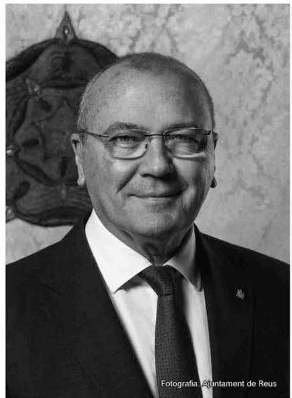
Carles Pellicer i Punyed Alcalde de Reus

Des d'aquestes pàgines, vull reconèixer un cop més la participació activa de totes les persones que fan de la celebració de la Setmana Santa un gran esdeveniment de ciutat. Un esdeveniment que té, en la presència dels Armats de la Sang, un element del tot emblemàtic.