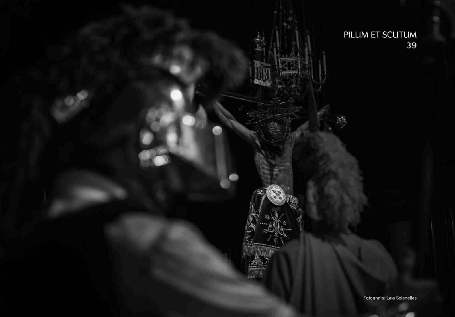
Fotografia: Laia Solanellas